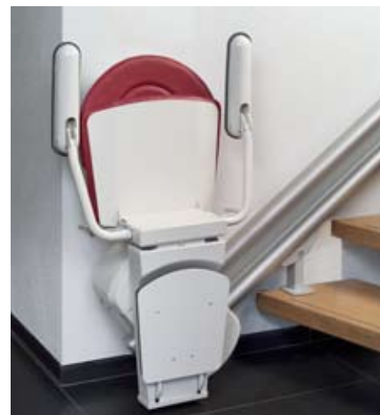
↑ Mécanisme compact et élégant.