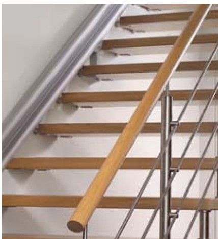
↑ Guide en aluminium particulièrement élégant.

La conception de ce monte-escalier est centrée sur la sécurité, le confort et la fiabilité. L'assise et le dossier confortables vous assurent une position agréable, sûre et commode. Le Jade est équipé d'une ceinture de sécurité et de nombreux dispositifs de sécurité. De même, si le monte-escalier détecte la moindre résistance en chemin, il s'arrête immédiatement. Une fois à destination, vous pouvez facilement faire pivoter le siège d'un quart de tour pour en descendre aisément et en toute sécurité.