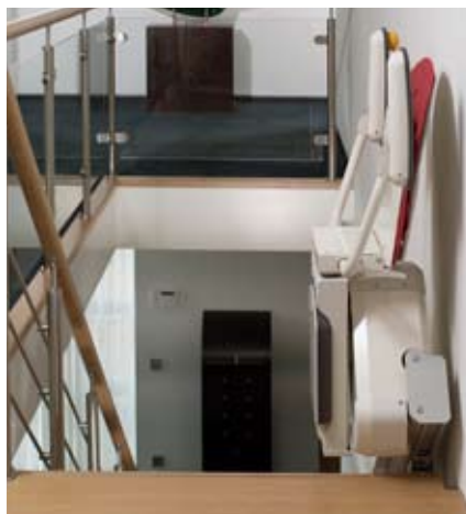
↑ Grâce à sa conception ingénieuse, l'escalier reste parfaitement accessible.