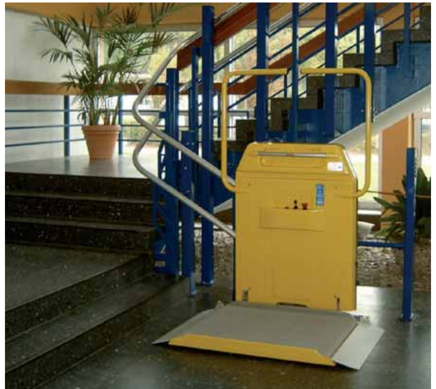
Plate-forme Handi-Lift 6 destinée aux installations avec courbes ou virages.

Tous ont été dessinés par les meilleurs designers. Ces objets sont conçus pour durer, rendre service de façon la plus simple possible et être agréables à regarder.