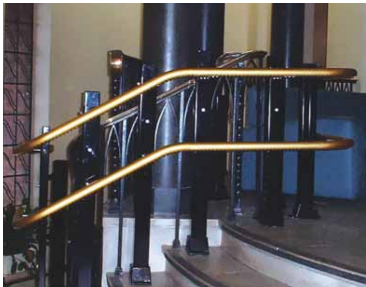
Un mélange heureux de luxe et de fonctionnel : une main courante mordorée support de plate-forme. HL6

Vous obtiendrez des rendus incomparables se fondant dans votre décor. Que pensez-vous de cette main courante haute en couleur et douce au toucher ?