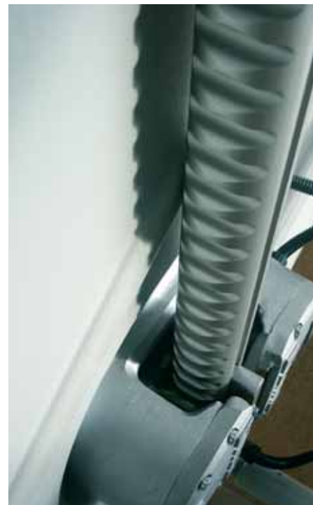
L'acier, l'aluminium sont des matériaux travaillés par notre fabricant CAMA, orfèvre en la matière.