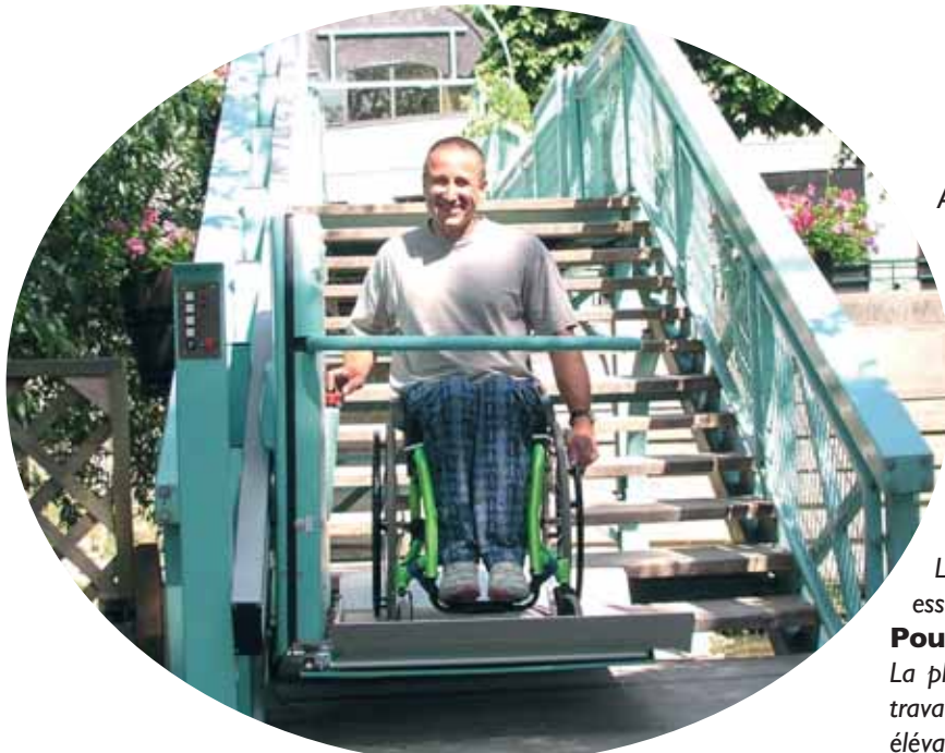
HL7 en extérieur