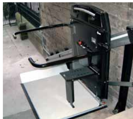
HL7 avec strapontin