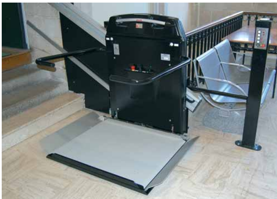
Une intégration parfaite dans un immeuble administratif classé Monument Historique. HL7

Appréciez le savoir-faire scandinave. Pour transporter une personne sur son fauteuil roulant en hauteur et dans un escalier, l'expérience d'un constructeur et la maîtrise de son métier sont des valeurs sûres.